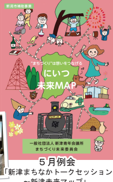
5月例会 「新津まちなかトークセッション ~新津未来マップ」

「にいつ夏まつり」「あきはなびまつり」「にいつハロウィン仮装まつり」など、地域の様々なイベントにも積極的に参加できたのではないかと感じております。様々な活動を通して委員会のメンバーや他委員会の方々にも支えて頂きました。この場をお借りいたしまして心より感謝申し上げます。