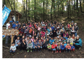
11月第1例会 「Akihaマウンテンプレーパークをつくろう!!」

来年も引き続き、このフィールドが愛され輝き続けられるよう、皆様のお力を借りながら事業を継続し、精いっぱい取り組んでまいります。フィールドでの活動は2016年度春からとなりますが、今後ともどうぞよろしくお願いたします!!