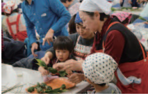
11月第2例会 「はさがけ米でおにぎりを作ろう！」