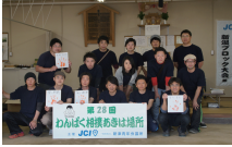
4月例会 「わんぱく相撲あきは場所」

当委員会は名前の通り1年を通してひとづくり事業を行ってまいりました。様々なひとづくりがありましたが、本年は秋葉区の子供達を対象とし、4月例会として秋葉区の小学生を対象としたわんぱく相撲あきは場所を開催しました。各学年別の男女別のトーナメントを行い、試合を通して勝負の厳しさや楽しさ、礼節の大切さを学んでもらいました。6月にはあきは場所を勝ち抜いたわんぱく力士と共に、県大会にも参加してまいりました。残念ながら全国大会への出場は叶いませんでしたが、選手の成長を感じられる素晴らしい大会でした。その他には、JA新津さつき様の「昔ながらのお米づくり体験」に小学生と共に参加し、田植え・稲刈り体験をし、11月第2例会としてそのお米を使った「はさがけ米でおにぎりを作ろう！」という事業を開催しました。参加者の親子には食育を通して、楽しみながら食べ物の大事さを学んでもらいました。