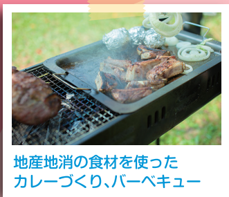
地産地消の食材を使った カレーづくり、バーベキュー